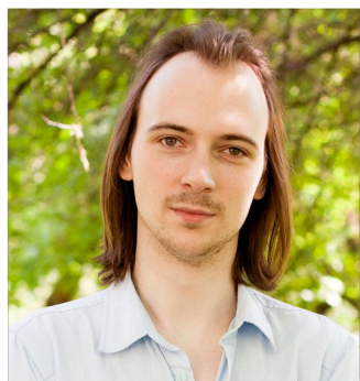
КОЛДУНОВ Леонид Модестович